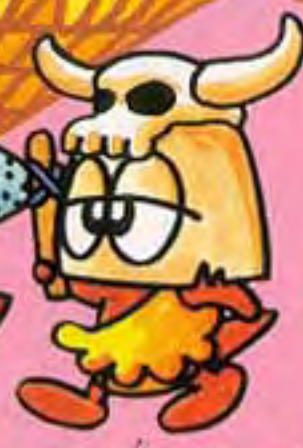
おの投げチツクン