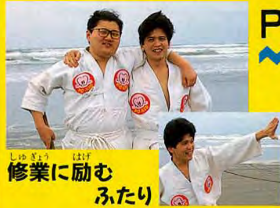
しゅぎょう はげ 修業に励む ふたり