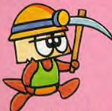
トンネルチツクン