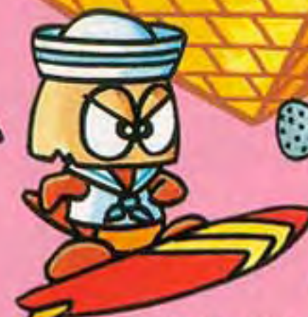
サーフィンチツクン